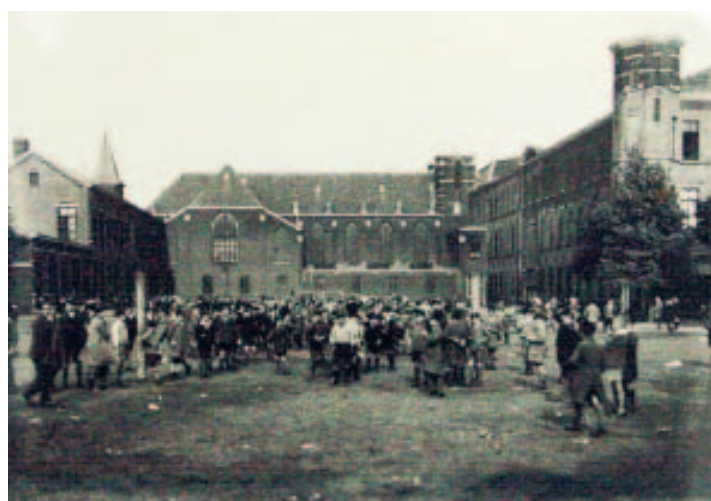
L'un des plus importants bâtiments de La Louvière...